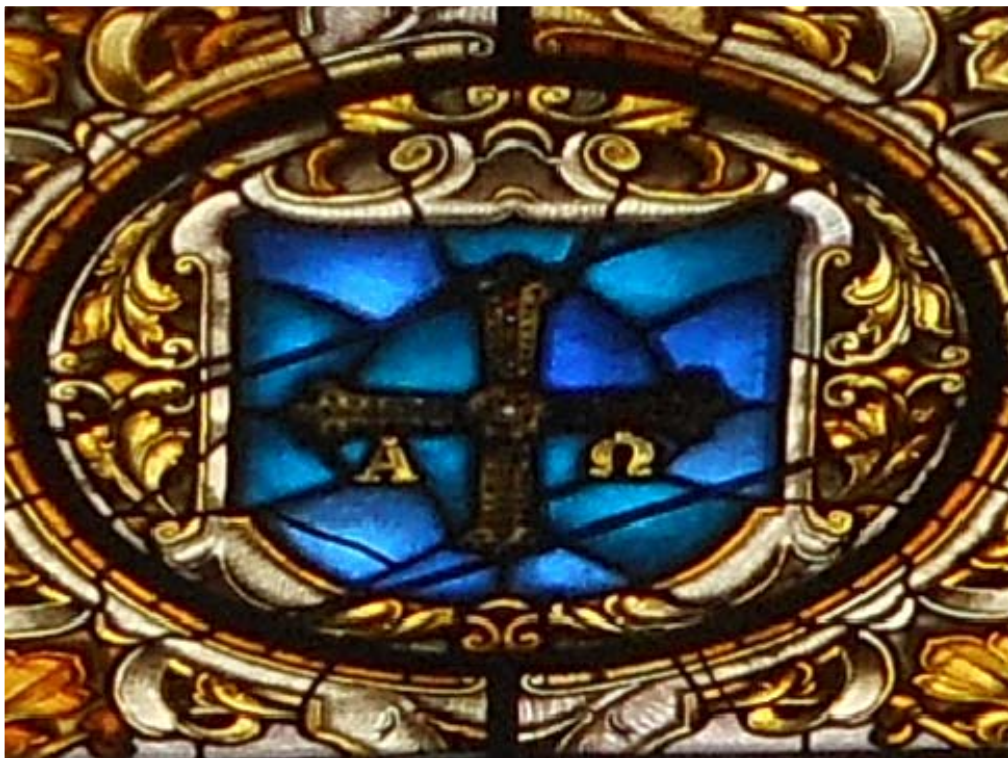
CUADRANTE 5, Cículo central. Tesela rota bajo Alfa. Dos líneas oblicuas paralelas cruzan en diagonal el escudo.