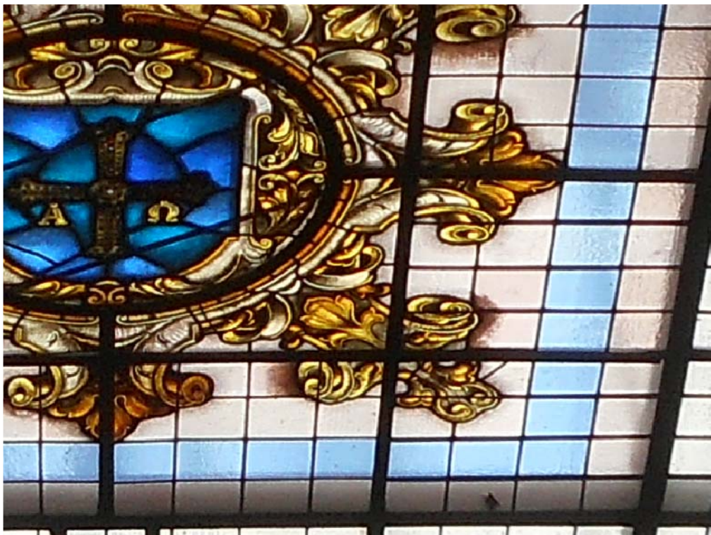
CUADRANTE 5, PIEZA 8H. Teselas rotas en 8H, 6H y círculo central.